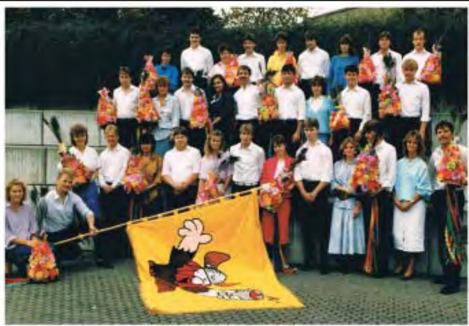
Silberne Kirmesburschen 2011 - Jahrgang 1965/66 (Kirmes 1986)