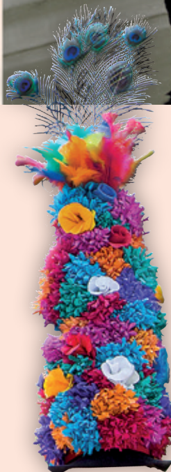
Kirmesburschen 1965 – Jahrgang 1946/1947