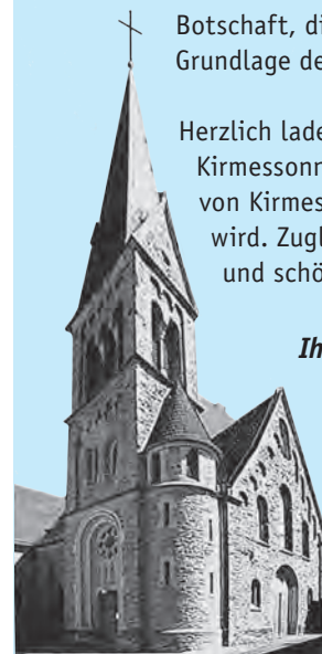
Alte und neue St. Jakobuskirche in Lindenholzhausen