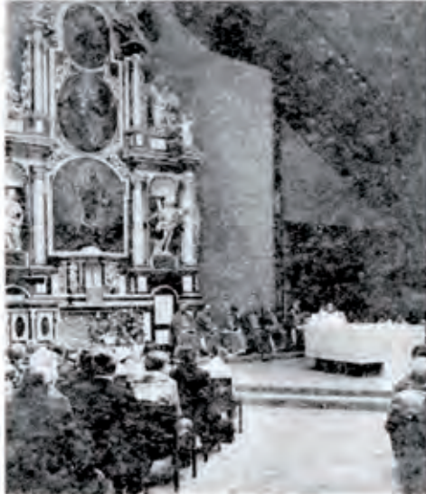
Blick auf den Hauptaltar vor der Altarweihe.