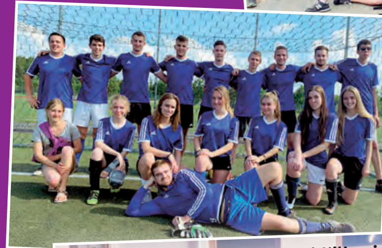
Beim Bürgerturnier im Juli 2019