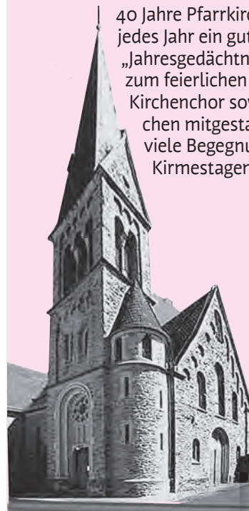
Alte und neue St. Jakobuskirche in Lindenholzhausen