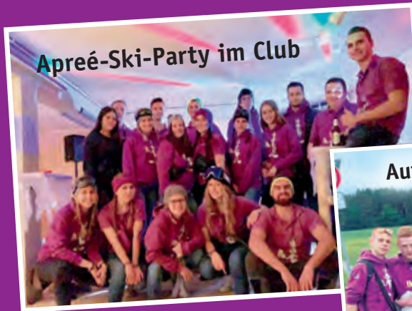
Apréé-Ski-Party im Club