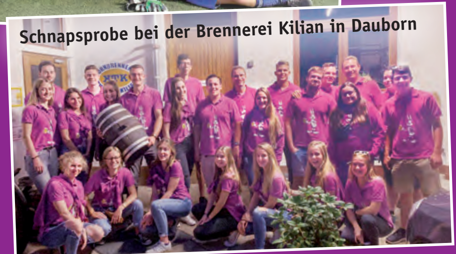
Schnapsprobe bei der Brennerei Kilian in Dauborn

Weitere Infos und Bilder gibt es auch auf: